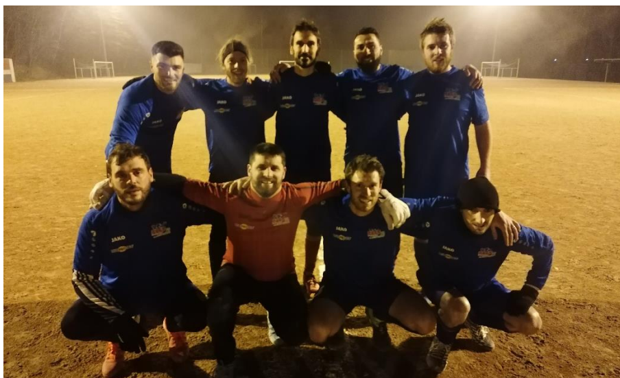
Equipe Football à 7 - CPAM 78

Merci à notre sponsor MURPROTEC pour les jeux de maillots offerts aux équipes de football à 11 et football à 7 du Comité FSGT 78