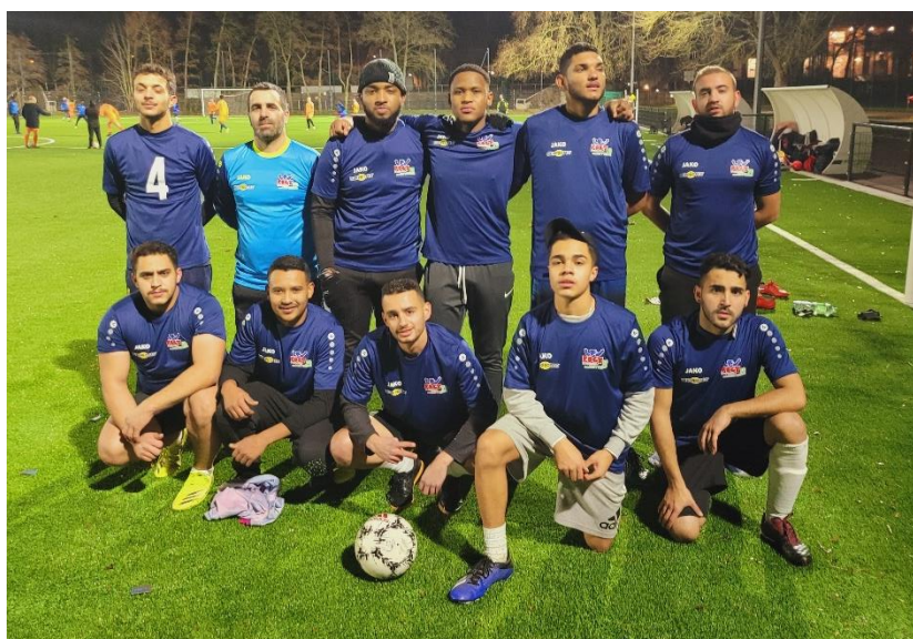
Equipe 2 Football à 7 - APB UNITED